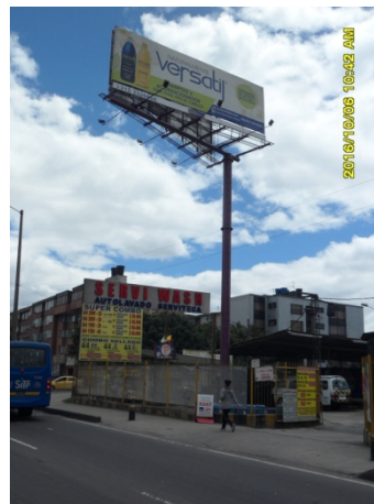
FACHADA DEL PREDIO Y