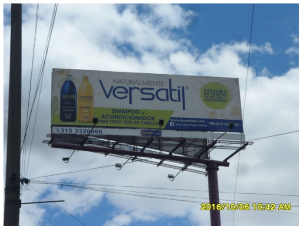
SENTIDO SUR - NORTE DE LA VALLA