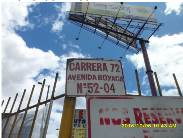
NOMENCLATURA DEL PREDIO