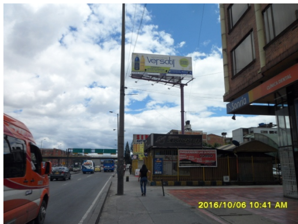
VISTA PANORAMICA COMERCIAL TUBULAR